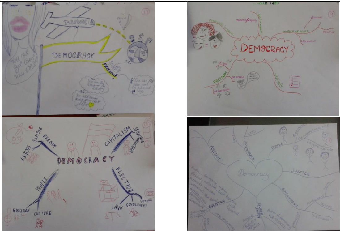
Şekil 1. Polonya’daki öğretmen adaylarının zihin haritalarından örnekler

Tablo 3 incelendiğinde öğretmen adaylarının zihin haritalarında ifade edilen güncel kavramların “olumlu”, “nötr” ve “olumsuz” kodları altında toplandığı görülmektedir. Bu kodlamada öğretmen adaylarının ilişkilendirme yaptığı simge ve çizimlerden “başkan”, “fabrikalar”, “ordu” ve “petrol kazıları” kavramları “olumsuz” kodu altında ifade edilmiştir. Bu kodları tekrar eden öğrenci sayısı eşit ve 1’er kişidir. Bu oran tüm öğretmen adayı sayısının %5,5’ine tekabül etmektedir. Öğretmen adaylarının genel anlamda demokrasiyi “tarih”, “yönetim şekli”, “kapitalizm” ve “para” ile ilişkilendirdiği görülmüştür. Bu kodları tekrar eden öğrenci sayısı eşit ve 1’er kişidir. Bu oran tüm öğretmen adayı sayısının %5,5’ine tekabül etmektedir. Buna ek olarak öğretmen adaylarının demokrasinin kökenini Antik Yunan’a dayandırdıkları hatta “demos” ve “kratos” sözcüklerinin birleşiminden demokrasiyi ifade ettikleri görülmüştür. Demokrasiyi bu şekilde ifade eden öğretmen adayı 5 kişidir. Bu oran toplam öğretmen adayı sayısının %27,7’sine tekabül etmektedir. Öğretmen adaylarının demokrasiyi ilişkilendirdikleri “olumlu” kavramlar “savaşa hayır”, “doğrudan demokrasi”, “temsili demokrasi”, “sivil toplum”, “iş”, “birlik”, “seyahat” kavramlarıdır. Bu kodları tekrar eden öğrenci sayısı eşit ve 1’er kişidir. Bu oran tüm öğretmen adayı sayısının %5,5’ine tekabül etmektedir. Öğretmen adaylarının zihin haritalarından örnekler Şekil 1’de verilmiştir.